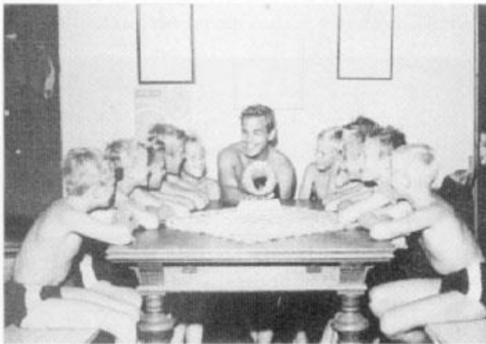
Frampojckarna under uppbyggnad.

Svenska Gymnastikspelen har avgjorts i Helsingborg där Frampojckarna deltog i både trupp och individuellt och vann.