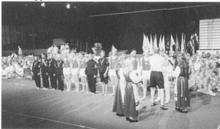
SM trupp och Turnpojkar.